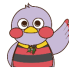
埼玉県のマスコット「さいたまっちゃん」